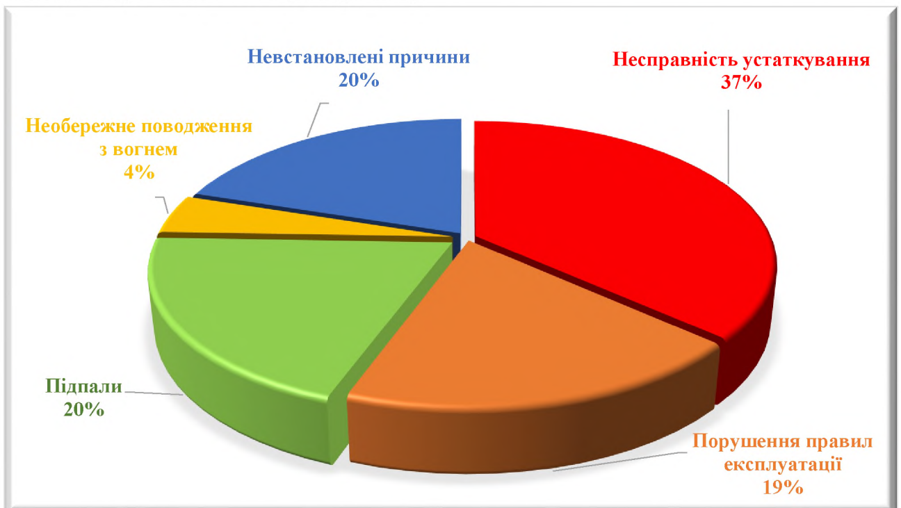
Діаграма 3. Причини виникнення пожеж на об'єктах закладів освіти

Найбільш поширеними причинами виникнення пожеж на об'єктах освіти є несправність устаткування, підпали та невстановлені причини, а також порушення правил експлуатації. Більшість пожеж, що сталися від підпалів та невстановлених причин, виникли на територіях об'єктів освіти, що не експлуатуються, але знаходяться на балансі місцевих органів управління освітою, закладів та установ МОН (Діаграма 3).