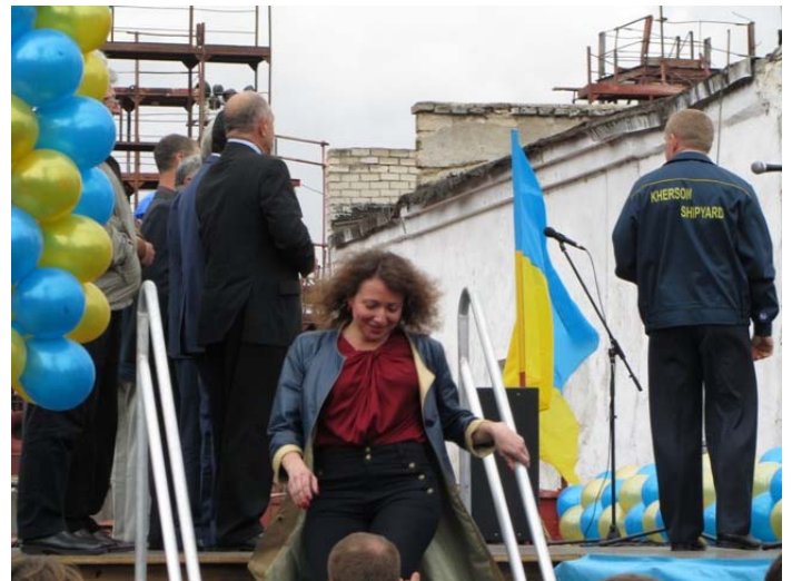
Пока руководители города и области выступают, крестная мать готовится выполнить свою миссию – дать судну имя и разбить традиционную бутылку шампанского о борт судна.