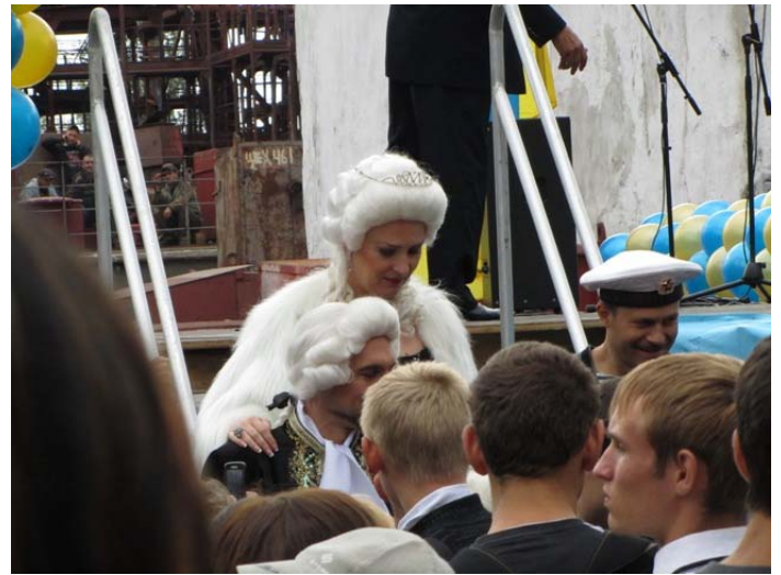
В гостях у директора у ХСЗ были: царица Екатерина II и князь Григорий Потемкин,